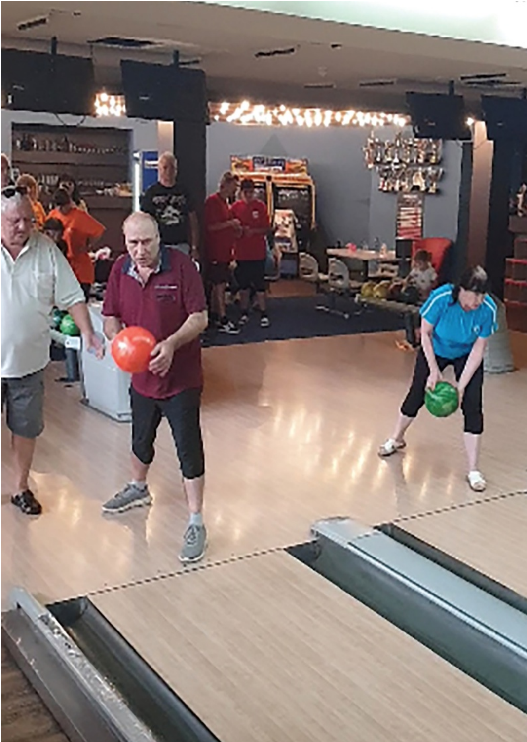
ЮБИЛЕЙ Кръгла маса "60 години организирана спортна дейност сред незрящите" и национален турнир по боулинг